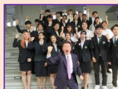
タイ バンコクのパンヤピワット経営大学の客員教授に任命されました。