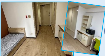
②3~7日用ゲストルーム 電子レンジ設置

1泊¥3,300 4~6泊¥7,700 (6泊で1泊¥1,283 とホテル代より安い)