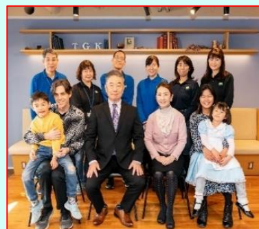
東京学生会館スタッフ一同