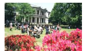
清泉女子大学の新生歓のガーデンパーティー