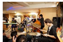
東京学生会館の新入館歓迎『JAZZライブ会』では世界的アーティストを観ることができます

そして、大学の職員の方々も毎回大変温かい御対応をして下さり、今回も心ゆくまで写真撮影をしたり、その美しさを堪能する事ができました。